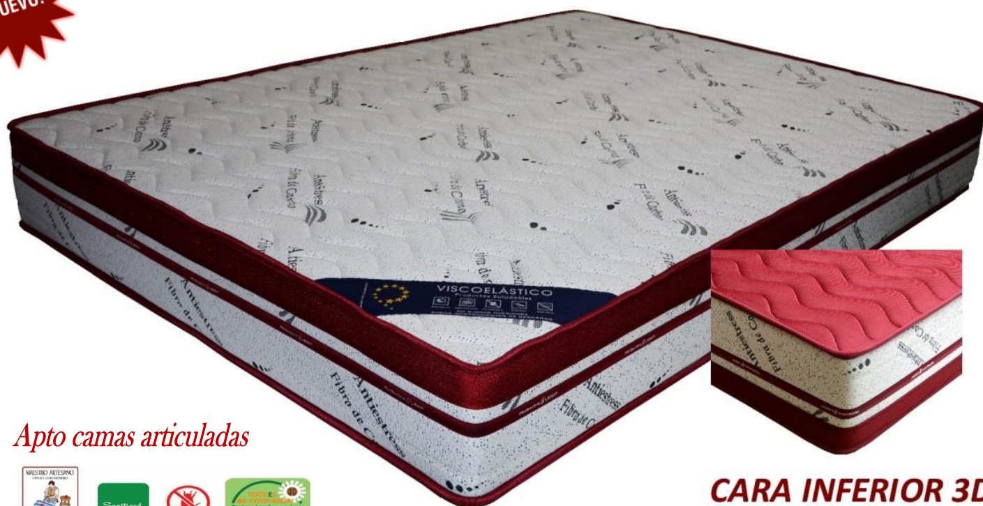
CARA INFERIOR 3D